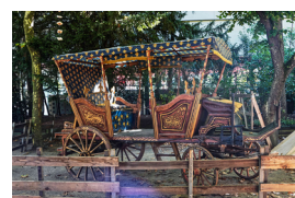
balade en calèche

Aller proposer aux commerçants des décorations de vitrines